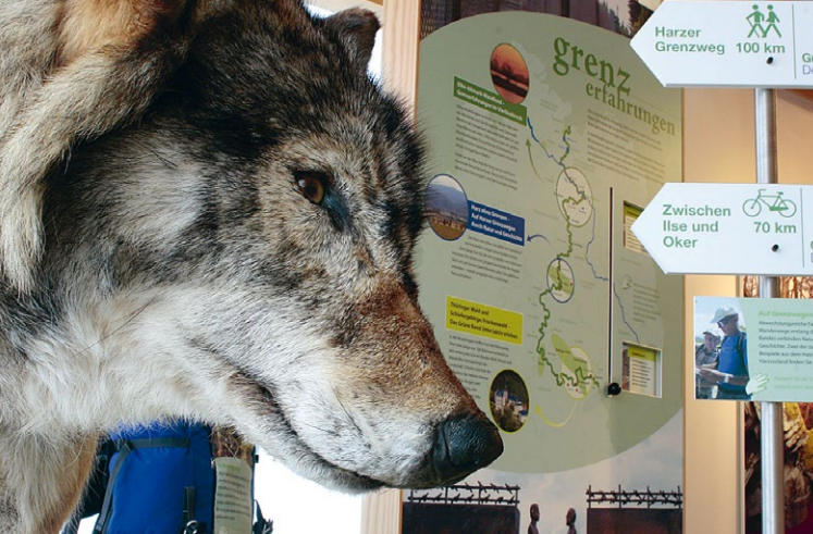
Begegnungen am Grünen Band. Noch ist der Wolf nicht zurück im Harz, aber wer weiß...?