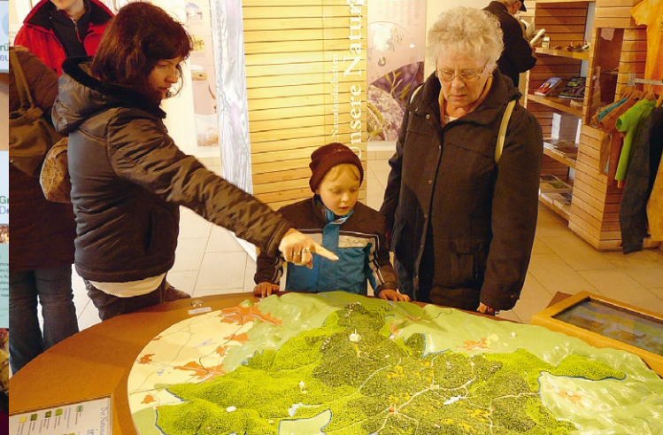
„Oma, wo liegt der Brocken?“ Ein Landschaftsmodell zeigt Ihnen den Harz aus der Vogelperspektive.