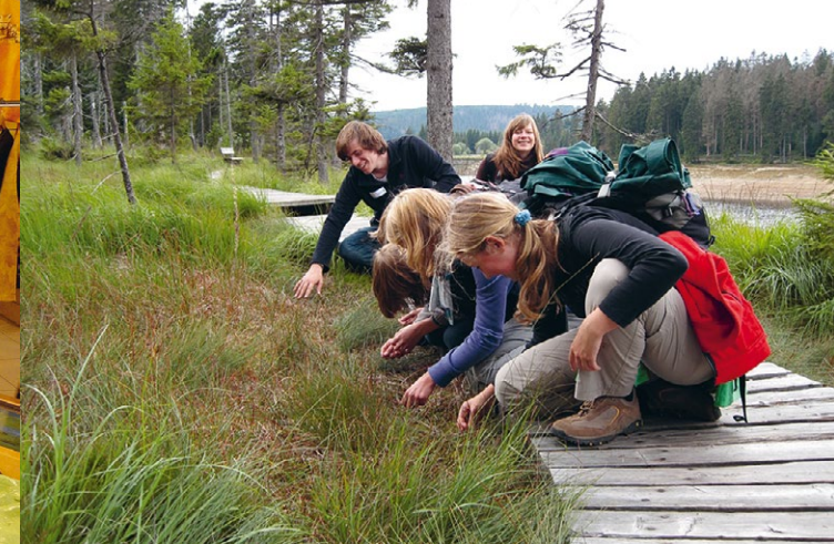
Eintauchen in die Wildnis: in Begleitung des Teams vom TorfHaus gefahrlos möglich.